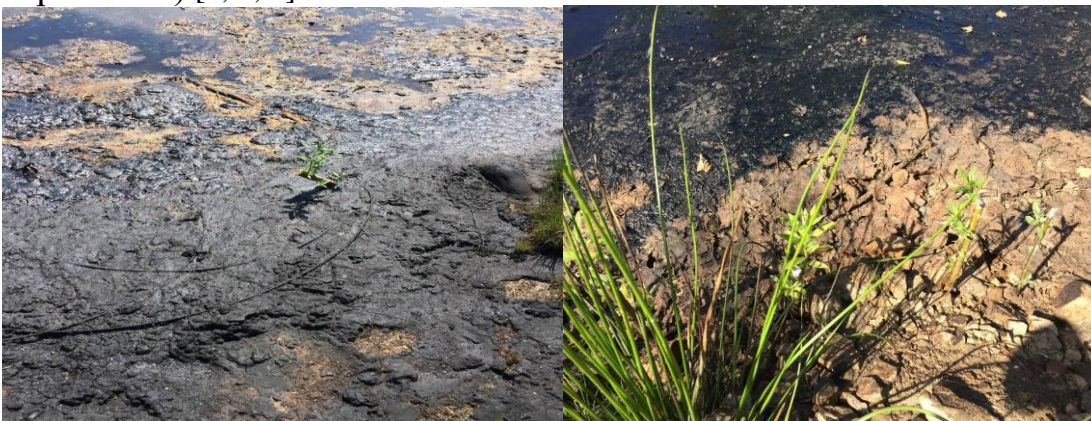
Рис.1. Нафто забруднені ґрунти в Богородчанському районі

Приведе до засолення і радіоактивного забруднення ґрунтів: радіоактивне забруднення – це потрапляння і накопичення в ґрунті радіонуклідів (Цезій-137, Стронцій-90, Калій-40) у концентраціях, що є вищими від фонових; Засолення – процес накопичення в ґрунтах легкорозчинних солей (хлоридів, сульфатів і карбонатів) [2, 5, 7].